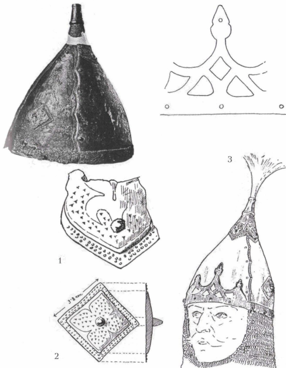
Рисунок 2. Шлем из Гожухи [1]

Налобное украшение шлема было повреждено, поэтому реконструкция делалась путём совмещения сохранившегося оттиска узора со шлема из Гожухи (рисунок 3) [1] (центральная часть) и прорисовки остатков украшения с Фридрихсберга (углы и центральный пестик).