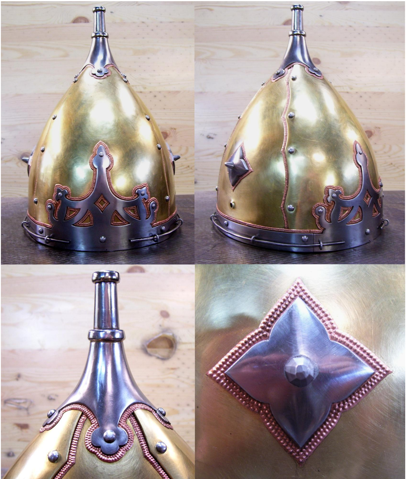
Рисунок 4. Реконструкция шлема из Gross-Friedrichsberg, мастер Будилов А.